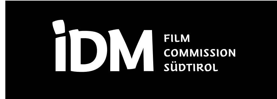
Variante Monochrom Invertiert (Weiß)