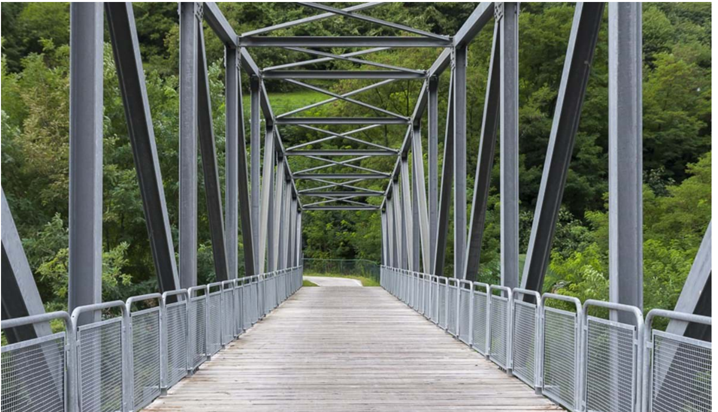
Defranceschi Daniel, © Defranceschi Daniel