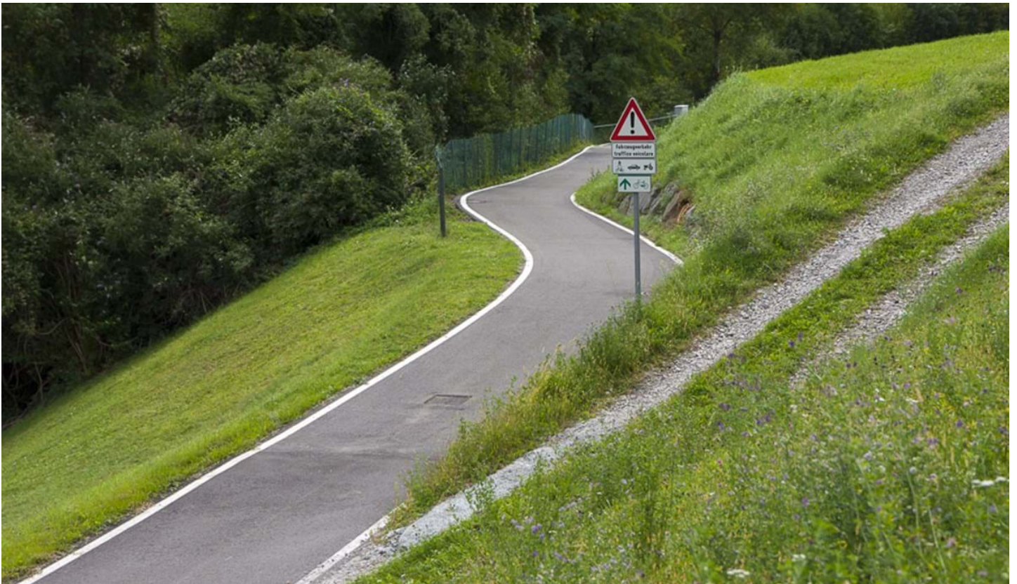
Defranceschi Daniel, © Defranceschi Daniel