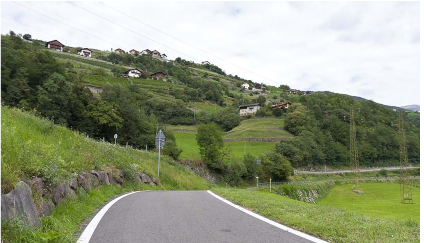
Defranceschi Daniel, © Defranceschi Daniel