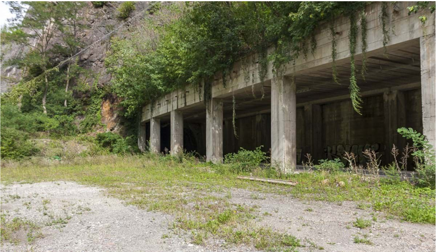
Defranceschi Daniel, © Defranceschi Daniel