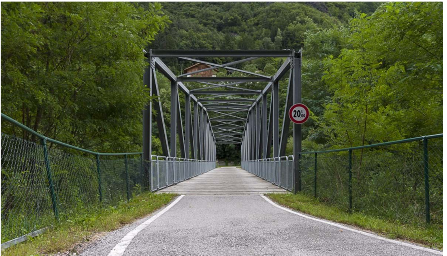
Defranceschi Daniel, © Defranceschi Daniel