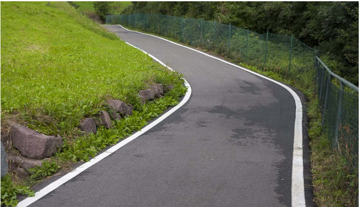
Defranceschi Daniel, © Defranceschi Daniel