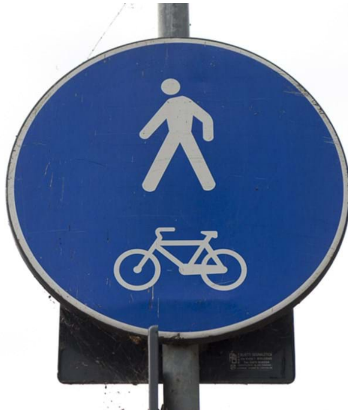
Defranceschi Daniel, © Defranceschi Daniel