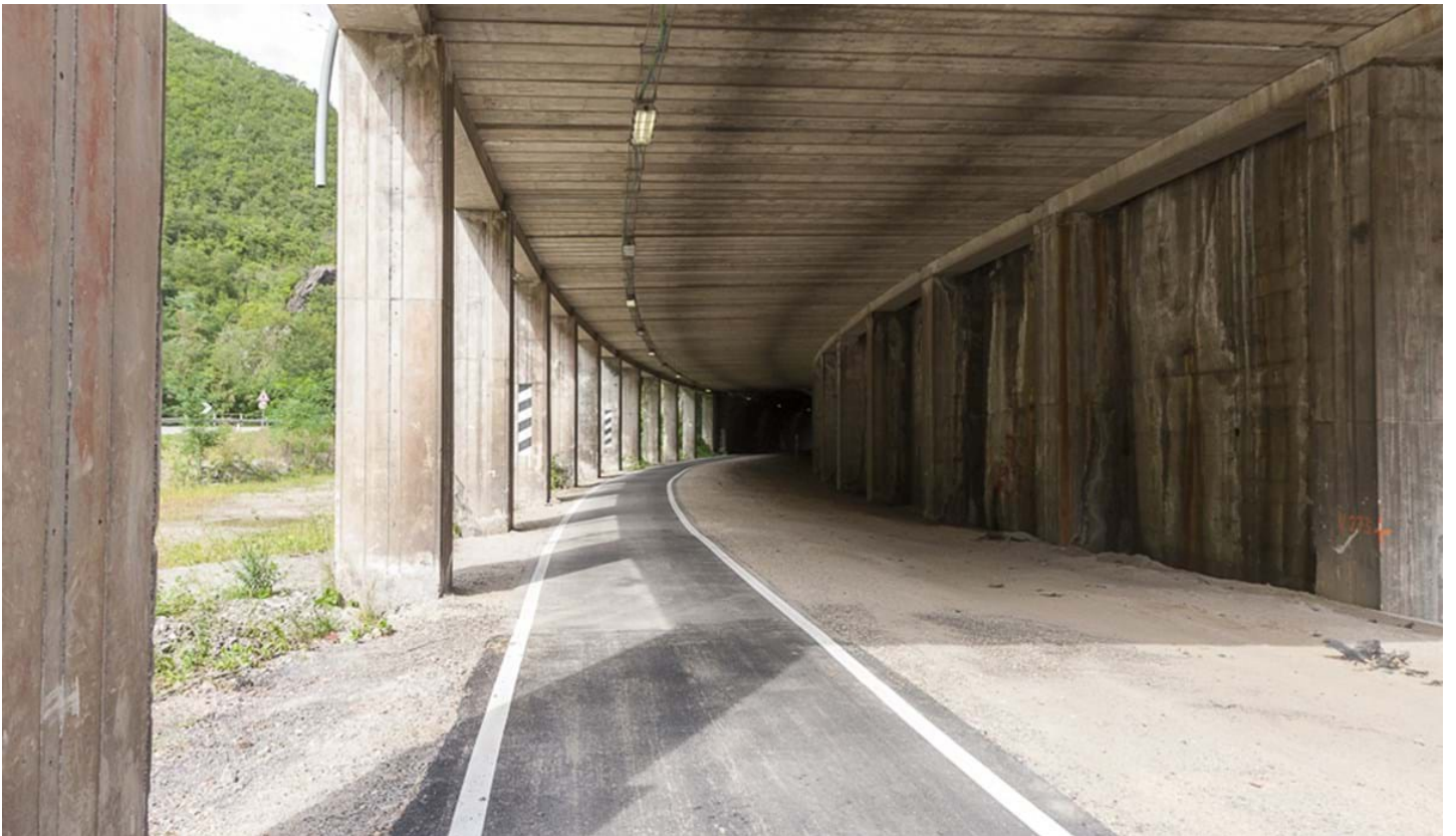
Defranceschi Daniel, © Defranceschi Daniel