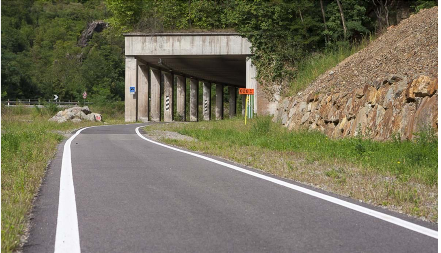
Defranceschi Daniel, © Defranceschi Daniel