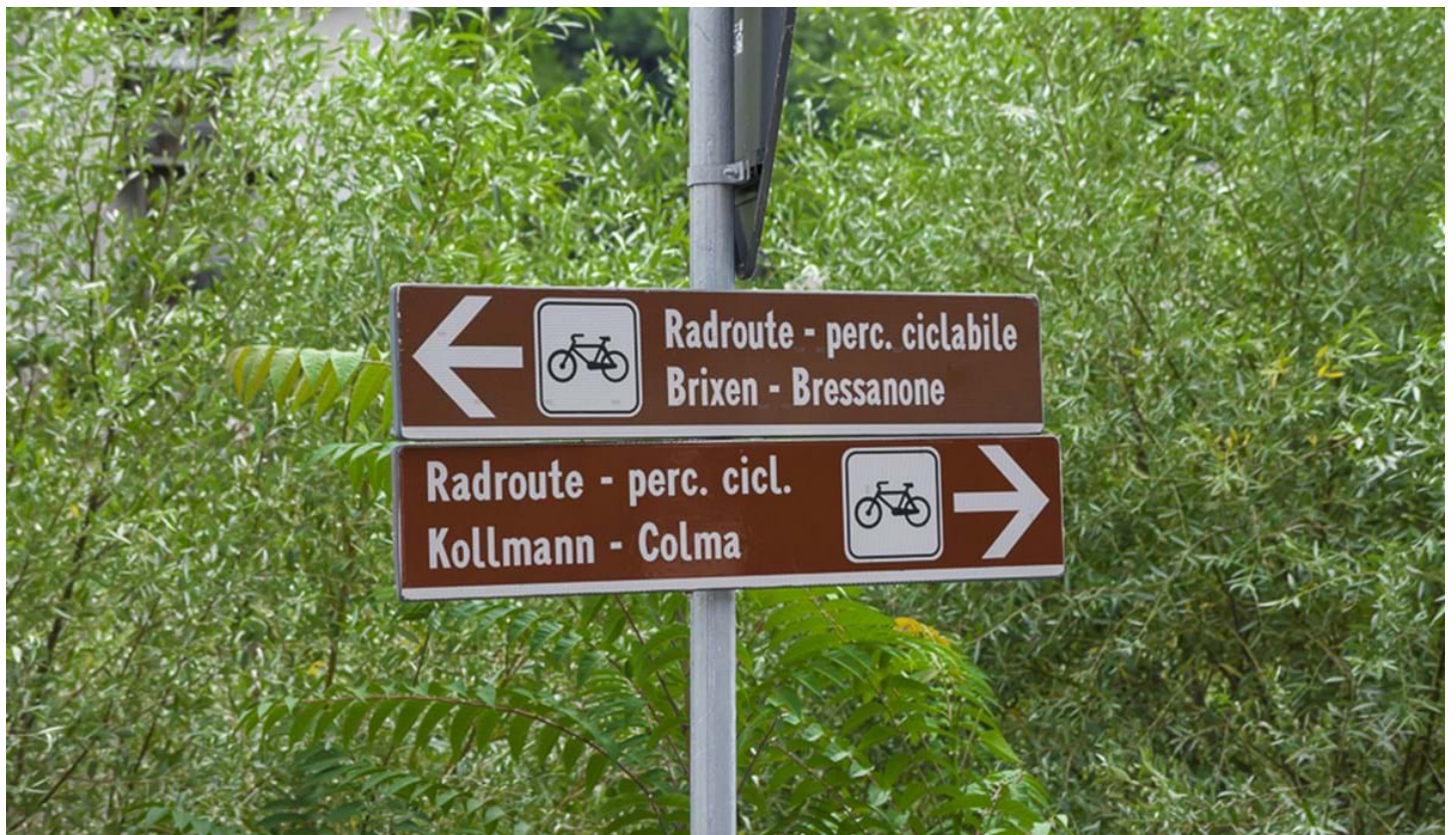
Defranceschi Daniel, © Defranceschi Daniel