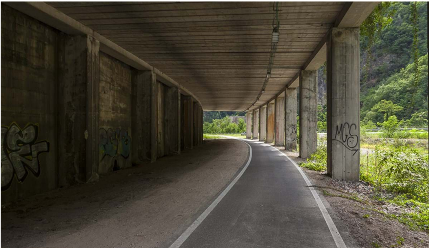
Defranceschi Daniel, © Defranceschi Daniel