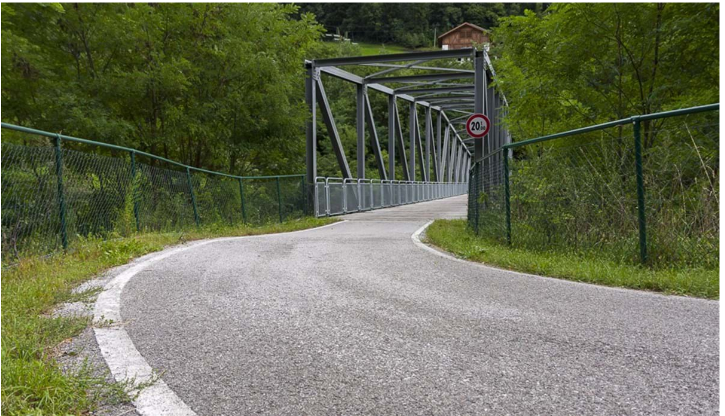
Defranceschi Daniel, © Defranceschi Daniel