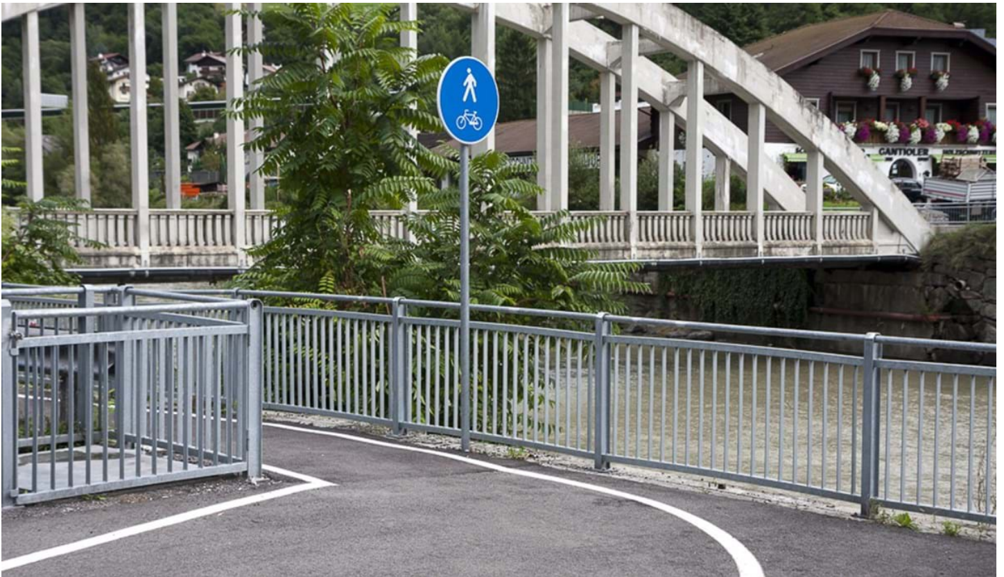
Defranceschi Daniel, © Defranceschi Daniel