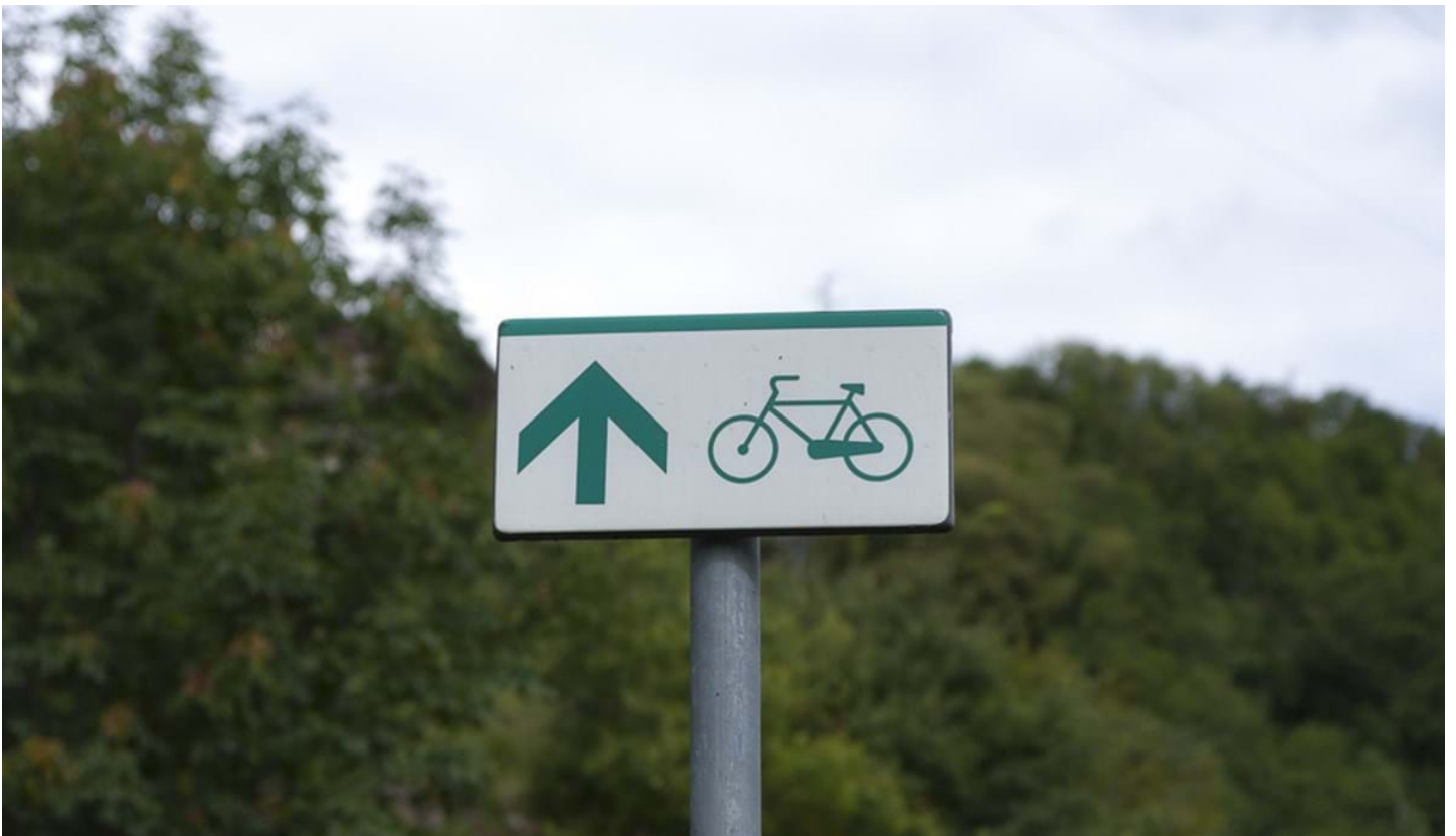
Defranceschi Daniel, © Defranceschi Daniel