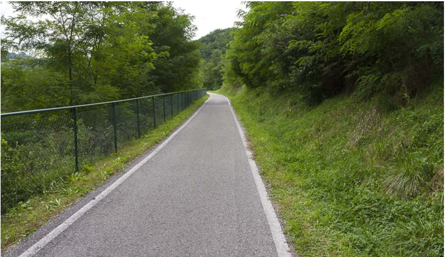
Defranceschi Daniel, © Defranceschi Daniel