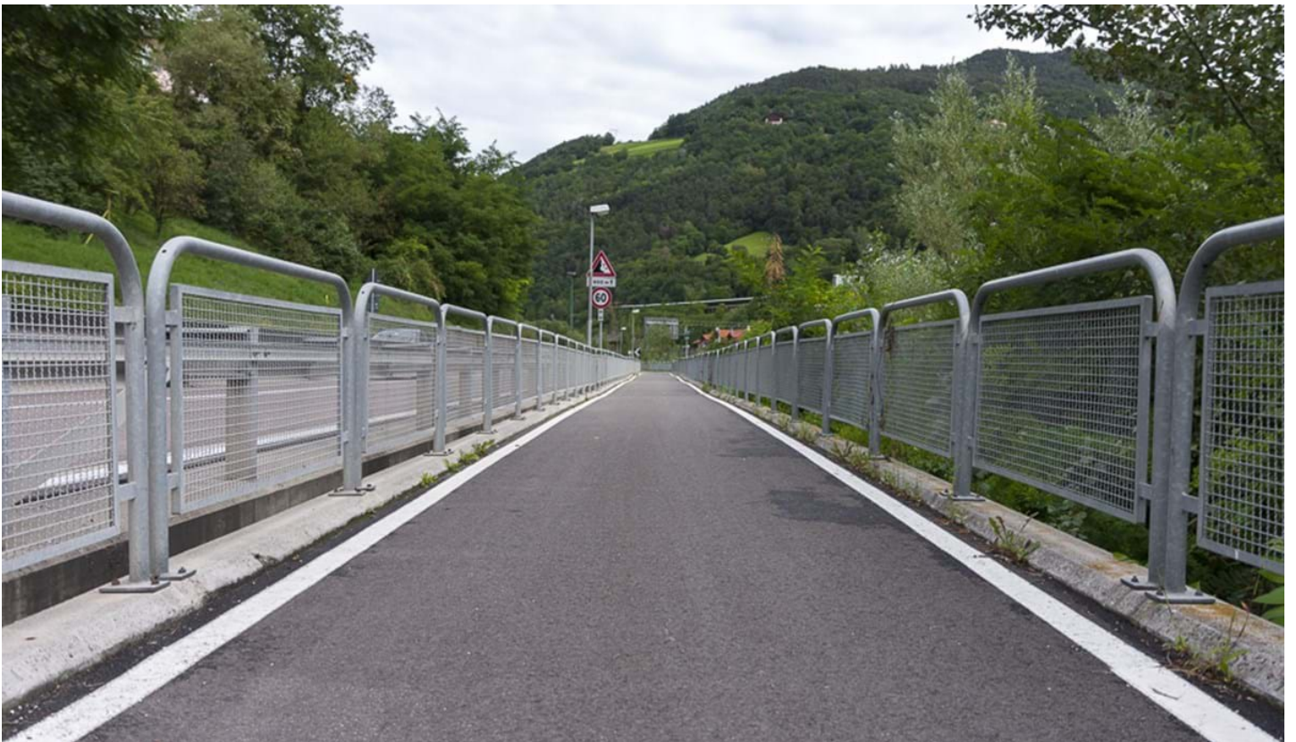
Defranceschi Daniel, © Defranceschi Daniel