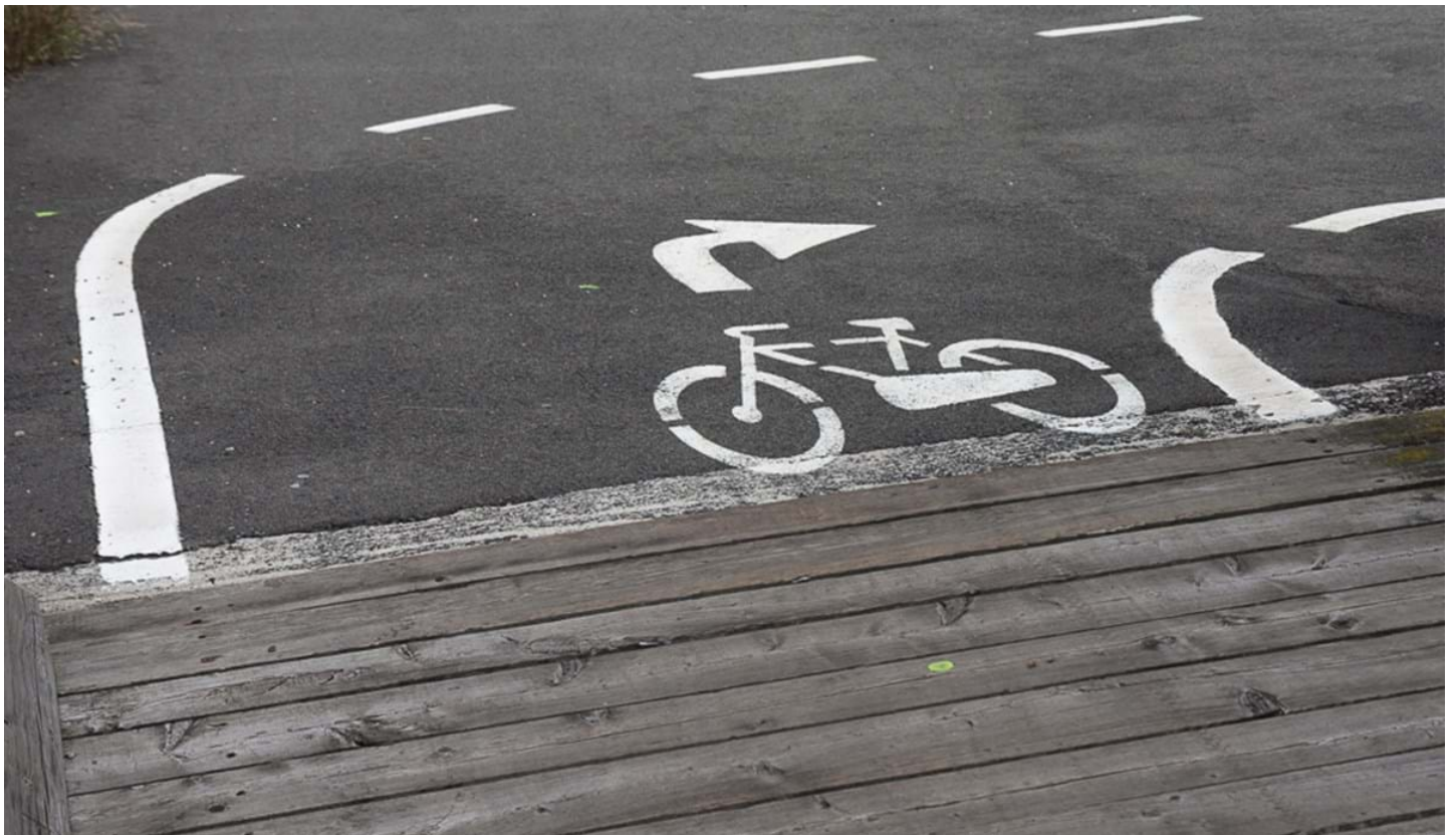
Defranceschi Daniel, © Defranceschi Daniel