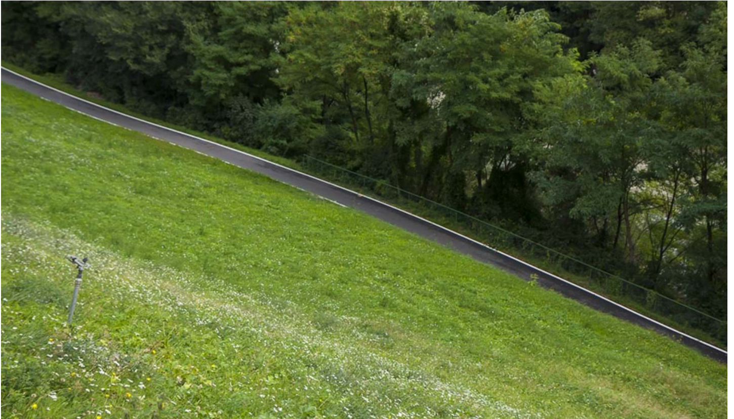
Defranceschi Daniel, © Defranceschi Daniel