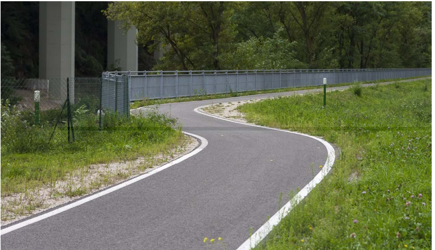
Defranceschi Daniel, © Defranceschi Daniel